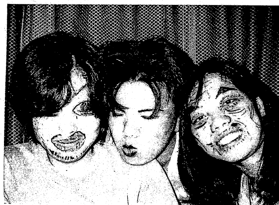
軽井沢遠征にはしやぎすぎたメンバー