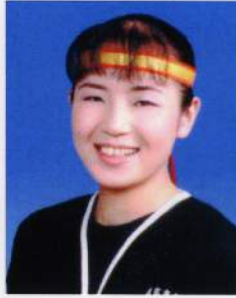
日本の未来は明るい☆