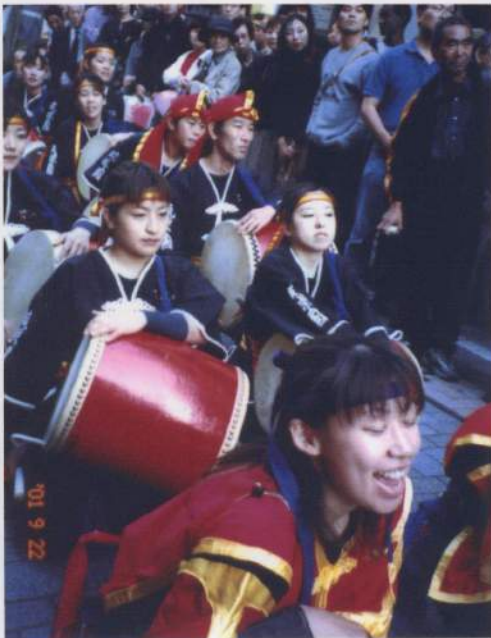
出番待ちの緊張場面！早く叩きたい☆☆☆

こがれていた新宿の中心街、いや東京の、日本の中心街でエイサーを踊っていることに感動していたのです。パレードは盛況の内に終了し、商店街の皆さんもとても喜んでくれていたのを