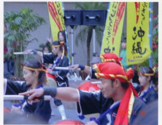
太鼓を見てくれた人たちに感動をしてもいい、さらに自分達も楽しく叩ける納得の演技を目指して日々練習に励んでいます☆

噂通り練習はハードで、右手はマメや水泡でボロボロ、あちこち筋肉痛、そしていつでも眠い・・・という毎日で