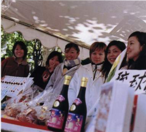
太鼓を叩く以外でもたくさん役割があります。デビュウしてからはなかなか出来ない悪方の役割はこの時期に覚えます。みんなしっかりねお覚えてね☆

21世紀初めての夏、私の人生を変える程の大きい出会いがありました。沖縄で行われた「1万人エイサー踊り隊」での、琉球國祭り太鼓との出会いです。物覚えの悪い私にも、沖縄の祭り太鼓の方々が熱心に教えて下さり、下手っぱいながらも国際通りで踊らせてもらいました。その楽しさが忘れられず、年齢制限ギリギリで、「雲の上の存在」だった祭り太鼓の神奈川支部に入ってしまったました。