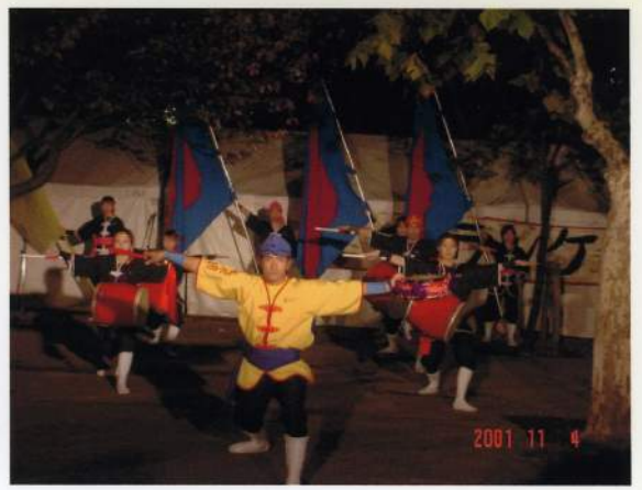
ちやらんけ祭りでの演舞。「神々の詩」より 十一月四日（東京中野）