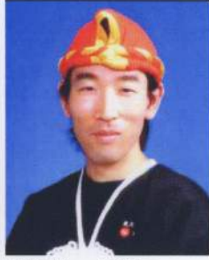
おめでとー！デビューは始まり。この感動を忘れないで精進しよう！

を重ねて自信をつけろと激励されたものの頭の中は真っ白。「ミルコムナリ」では体がガチガチ、「クーダーカー」では演技の途中で自分がいつかは練習していた位置（右側）ではなく左側にいることに気がつきビクビク。（そして逆を向いてしまいました）さらに曲について行くのが精一杯の「年中口説」などあつという間に終わったデビューの舞台でしたが、自分にとつては最高に充実した楽しい時間でした。励ましてくれたメンバーのみんなにも感謝していただきます。ありがとうございました