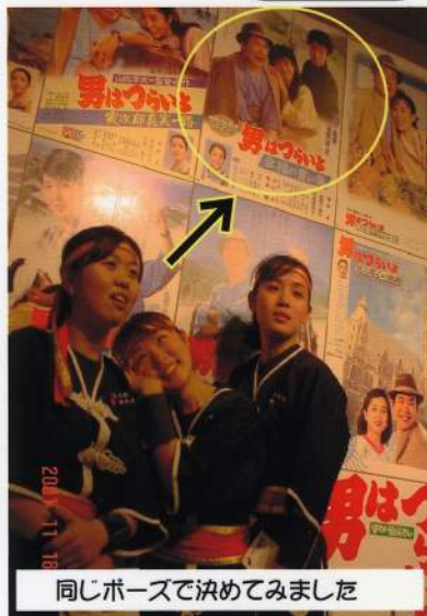
同じポーズで決めてみました

*新規で「ゆんたくひろば」郵送希望の方は郵便かFAXにてお名前、住所（含、郵便番号）をお知らせ下さい*