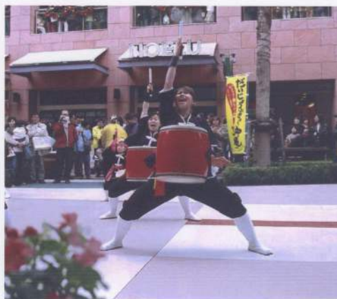
ガンバ！新人！早く一緒に太鼓を叩こうね！！

す。でも、「しんどい」よりも、憧れの祭り太鼓に入った「嬉しさ」の方が大きく、そのしんどさもまた楽しめるようになりました。イベントでの旗持ちも楽しくて、青空の下で風に舞う旗を見ていたり、持っているのと、ワクワクしてきます。そして「この旗を目印にして神様