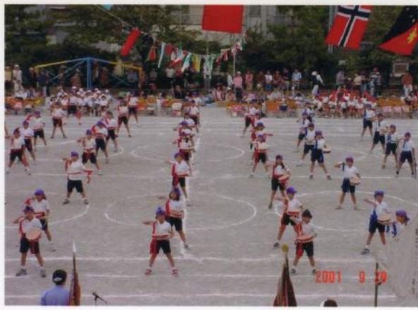
みんなカッパよかったよー大きくなったら一緒に叩こうね！

で、見ていてとても楽しかったです。当日は晴天に恵まれ、大きな校庭で皆が力一杯叩いている姿をみて嬉しくなりました。隊形のバリエーションも豊富で、それぞれヘーシ（かけ声）も元気良く、新鮮な気持ちになりました。そして祭り太鼓の出演の時「七月エイサー待ちかんでい」で、水神小学校のみんなと一緒に演技をしました。最後に、控教室として使わせてもらったので、とってもおいしかったです！