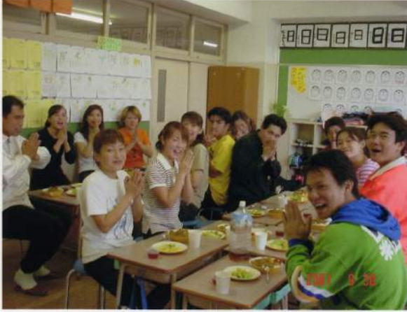
いつだってさっすーみんな残さず食べましよう！