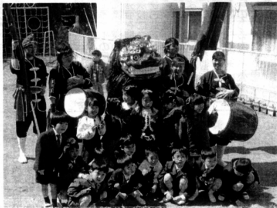
子どもの笑顔と元気を分けてもらえた楽しいイベントでした。

私が勤めている保育園の保護者会行事に出演しました。 相手は0~6才の子ども達...どんな反応をするのか、期 待と不安でいっぱいでした。 初めて出会った太鼓...びっくりしている子もいました。 そんな中での♪獅子ゴンゴン。当然しーしーが出てきま