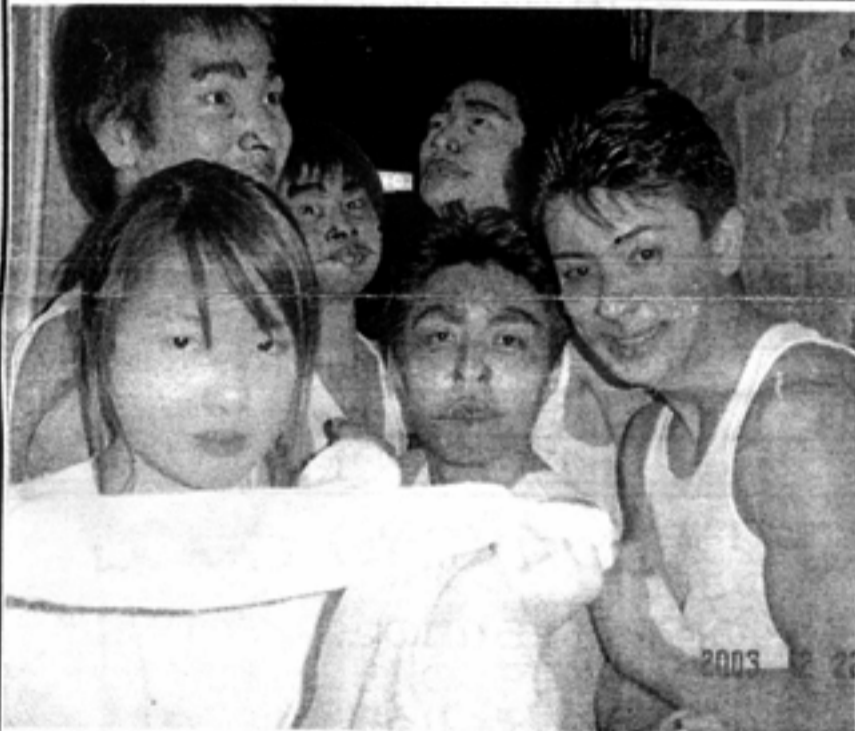
謎の轟雷団と女将範。この集団が何をしでかしたかはさておき、仲間のために体を張って場を盛り上げる姿に思わず(笑いすぎ)涙...