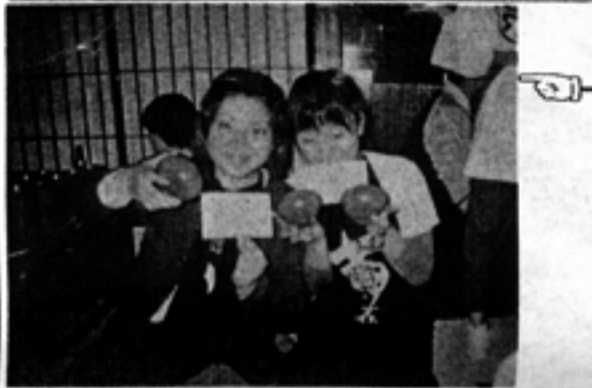
大盛岡一帯を回った後はもう2度とやらぬいと誓ったのだか... このお入は女性トップ2のつわも... のです。その枚数は...