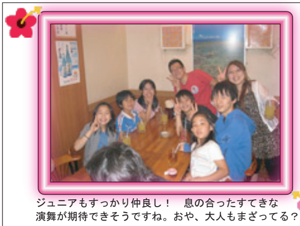
ジュニアもすっかり仲良し！ 息の合ったすてきな演舞が期待できそうですね。おや、大人もまざってる？