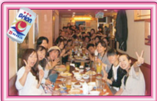
親睦会の様子です。みんな参加した動機を語ったり、意気込みを分かち合ったりして、盛り上がりました。

沖縄が好きで、沖縄の文化に触れたいと思い探していた時に今回の新宿エイサーまつりの募集を見つけた。でも実は新宿エイサーまつりを見たことがなく、琉球國祭り太鼓がこんなにも大きな団体ということも知りませんでした。初めての練習ではみなさんの熱気に圧倒され、甘く考えていた自分を反省しました。今は練習についていく事に精一杯ですが、少しでもメンバーのみなさんに近づけるようがんばりたいと思います。新宿エイサーまつりを楽しみたいです。よろしくお願ひします。