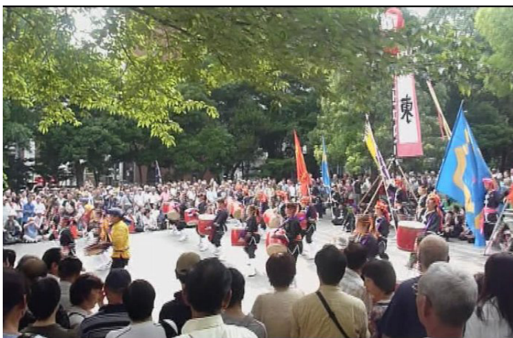
→上野公園内 袴腰広場にて

沿道を埋め尽くすたくさんのお客様にも喜んでいただくことが出来たと思います。 袴腰広場での演舞では、旗頭チームに旗頭の紹介、琉球古武道の演技なども披露していただきました。 エイサーだけでない沖縄の伝統芸能の奥深さをご紹介できたと思います。 もっと多くの方が沖縄に興味を持ってくださるきっかけになればいいな、と思いました。 (小村 志津乃)