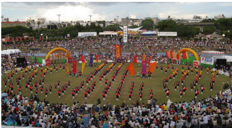
総勢 200 名での迫力の演舞 !!