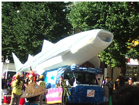
全長 10m の巨大ジンベエザメ !!

他支部メンバーや一般チーム、これまた沖縄から来ていただいた旗頭チームも合わせて総勢75名に及ぶ一団を率いて、うえのの街をジンベエザメが悠々と泳ぎゆく姿は、迫力満点でした。