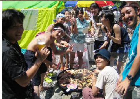
お肉に群がるメンバー達