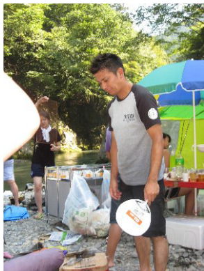
くっそー！ビール飲みたい！！ by 運転手