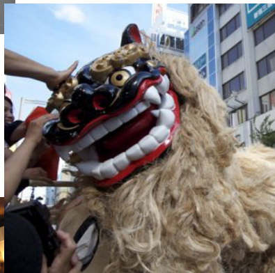
獅子が大人気！ 頭ナデナデ

があったものの、みなさんの協力のもとなんとか本番へ。沿道に並ぶ観客の多さに感動し、期待通りとてもいい反応でした。私たちもテンションがアップし、満足のいく演舞ができたと思います。 「また来年よろしくね！」「次はどこでやるの？」「感動した！」という、うれしいお言葉をたくさんいただくことができました。 追浜商店街をはじめ、ご協力いただいた皆様、どうもありがとうございました。 （遠藤 由香）