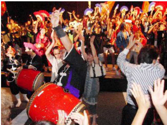
←毎年恒例の力チャーシーで今年も締めくくりました。