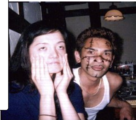
このコーナーの常理さんの「はげら〜」 踊る阿呆に観る阿呆。同じ阿呆でもこんなアホにはなりたくないものです。