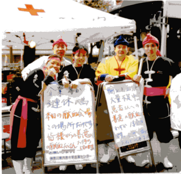
二十歳を過ぎたら献血に行こう!

三月十九日(日) 神奈川支部を設立するにあたり、新メンバー募集のため横浜駅前前で急きょ「ゲリラ活動」を行うことになった。駅前にはたくさんの方でこた返す中での強行で、沖縄エイサーを横浜の人々に披露した。すぐに人だかりの輪ができて、みなとてもノリが良く、楽しく太鼓を叩くことができた。たまたま献血車の前のスペースを使わせてもらうことができて、献血協力のノウハウも兼ねて、祭り太鼓メンバー十名が献血に協力させてもらった。日本赤十字社の方々も大変親切で、400mlも