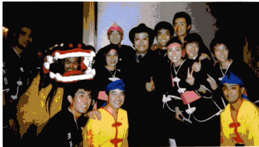
ハイポーズ! 芸能人で宝生舞、細川ふみえ、西田敏行等と記念撮影しました