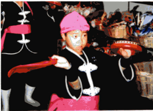
真剣なまなざしのタックン！