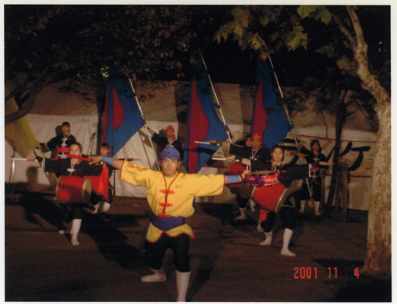
ちやらんけ祭りでの演舞。「神々の詩」より 十一月四日（東京中野）