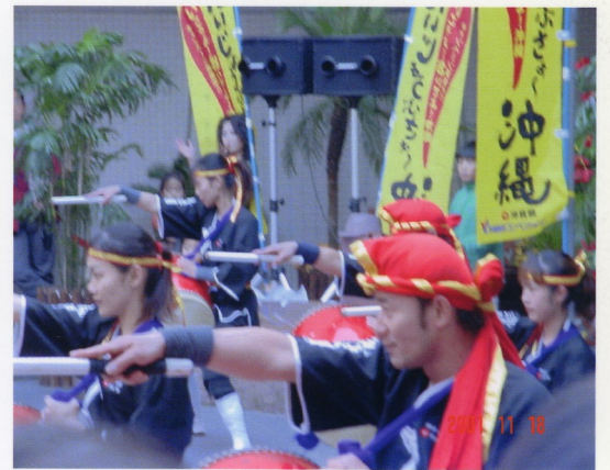
太鼓を見てくれた人たちに感動をしてもらい、さらに自分達も楽しく叩ける納得の演技を目指して日々練習に励んでいます☆

噂通り練習はハードで、右手はマメや水泡でボロボロ、あちこち筋肉痛、そしていつでも眠い・・・という毎日です。