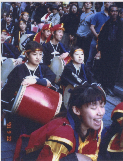
出番待ちの緊張場面！早く叩きたい☆☆☆

して人数をあつめることができませんでした。この仕事が一番大変でした。また、3日間のスケジュールを組むのにもとても手間取ってしまいました。それぞれ東京へ来る飛行機の時間も違うし、新幹線やバスで来てくれたメンバーもいたので迎えの割り振りなどもとても気を使いました。でも、何とか細かく全日程の担当まですべて決めることができたので、あとは関東のメンバーが思ったように動いてくれれば何とかなりそうでした。 当日は商店街の皆さんと私達の祈りが天に通じたのか、とても晴れ上がったいい天気。あとはメンバーの気持ち祭りを祭りのリズムに乗せるだけ！ そして本番、想像していた以上に多くの人で埋め尽くされている通りを前に自分も含め、メンバーたちの鼓動が高まっていくのを感じました。もう何の心配も無かった。そこには自信に満ち溢れるメンバーの姿があったのです。ものすごい快感の中、最高の気分で太鼓が叩くことができました。前から自分自身あ