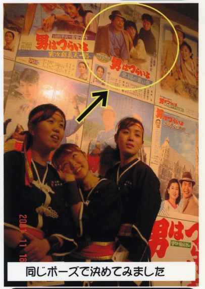
同じポーズで決めてみました

*祭り太鼓の冬は、練習強化期間でもあります。その合間に老人ホームや施設等の慰問なども行っております。慰問を希望される場合は関東事務局までお問い合わせ下さい。 *その他の各イベントの詳細につきましても、同様に祭り太鼓関東事務局へお問い合わせ下さい。 尚、携帯電話への問い合わせは仕事の関係上夕方以降にお願い致します。 イベントによって期日直前まで内容が決定しないものもありますのでご了承下さい。