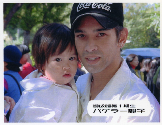
御成婚第1期生 バゲラー親子

～先輩より～ バゲ：「家族サービスすなわち思いやりが田圃の秘訣だよ」 バゲル「そーでちゅーおもちゃとミルク、チョコもちゅれないてねー！バフバフ」