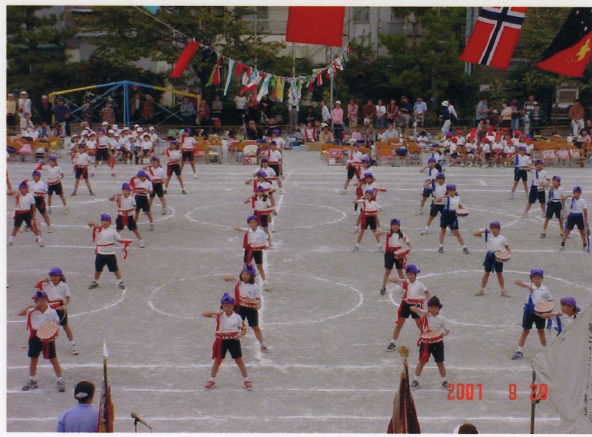
みんなカッパよかつたよ！大きくなったら一緒に叩こうね！

で、見ていてとても楽しかったです。当日は晴天に恵まれて、大きな校庭で皆が力一杯叩いている姿をみて嬉しくなりました。隊形のバリエーションも豊富で、それぞれヘーシ（かけ声）も元氣良く、新鮮な気持ちになりました。そして祭り太鼓の出演の時「七月エイサー待ちかんでい」で、水神小学校のみんなと一緒に演技をしました。最後に、控え室として使わせてもらった教室で食べた給食は懐かしくて、とってもおいしかったです！