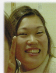
ガンバし新人！早く一緒に太鼓を叩こうね！！

が降りてくるんだなあ」と嬉しくなります。太鼓を打てるようになったら、もっともっと楽しいんだろなああと、考えるだけでもかなり幸せ気分です。 ・・・考えるだけで終わらず現実になるように、さあ、今日も張り切って、練習、練習 ゆか