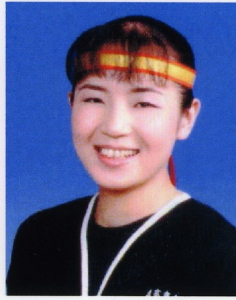
日本の未来は明るい☆