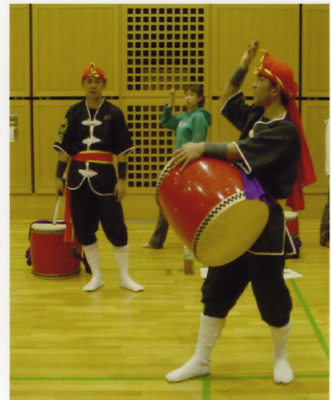
日々研鑽。演技チェック、指導に終わり無し

さて関東地区を結成してから早六年が過ぎました。思い起こせば、ここ東京で何も無い無の状態から借金をして購入した十個の太鼓で、がむしゃらに練習し、沖縄へも幾度か足を運び演技を教わり、またビデオに収録し東京に持ち帰るなど、毎日どんな場所でも練習に励んだことをついこの間の事のように思えます。最初の一年目は、イベントの依頼を受けてない場所や公園など、色々な場所でエイサーを披露し、一人でも多くの方々に沖縄の風を伝えたく一生懸命太鼓を叩いてまいりました。二年目には演技により磨きをかけ、以降、自らの力で大勢の人にってもらいたく三周年、五周年という自主公演も行ってきました。これも大勢の方々のご支援のおかげと、心から感謝致しております。しかし、人間はいつしか初心を忘れしうることがあり、現在関東地区メンバーの中にもイベントの依頼があるというのに感謝の気持ち忘れ