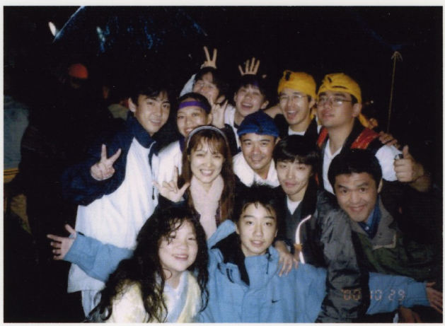
「ひよこっち」メンバーとの共演。イベントで関わった人々たちからもう贈り物はいつも心温まるものです。