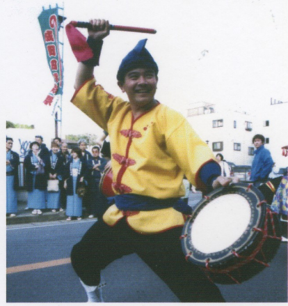
ムトメノカニの伊保支部長後ろにいるのはファンクラブのマダムたち

す。今回は指導部長からの提案で演技の教本という形でビデオを作成することになり、来る7月と9月に各支部の指導員が沖繩に集まり、今までの少しづつ違っていた各支部間の演技細部分の統一を行う予定です。あとひとつ、大きな企画があがっていました。あの、リオのカニ二バルに出演しようという話がでてきたのです。これにはびっくりしました。これからブラジル支部と連携を取りながら出演できるように企画を進めていくようです。世界中でも名の通った、とてもビッグなお祭りなので個人的にも是非参加してみたいです。これから夏本番に向かい、関東地区もイベントがめぐる押しはじけて、全国を駆け巡る