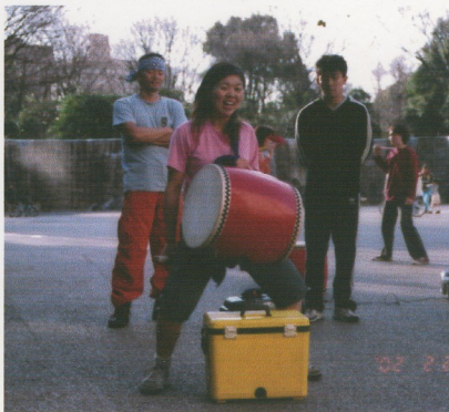
厳しい練習！何事も基礎が大切です。

去年、祭り太鼓のメンバーである寮の先輩に誘われて、旗持ちとして新宿祭りに参加しました。そこで初めて祭り太鼓の演技を見て、自分も踊ってみたいと思い祭り太鼓に入りました。最初の数ヶ月の「パチ回し」や「足上げ」は大変でしたが、基本曲に入って演技を習い自分が少しずつ踊れるようになるのが楽しいです。これから、多くのイベントが7月・8月・9月・10月とあるので早く演技を覚えたいです。特に新宿祭りには打ち手として参加できるように頑張ります。