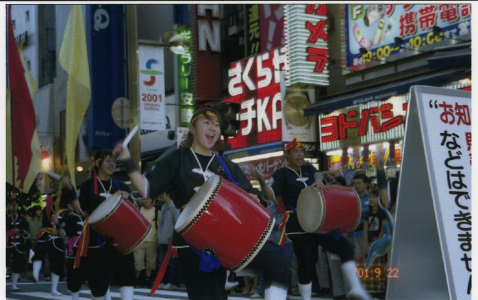
昨年行われた新宿まつり演技より

原点である伝統エイサーと共に、その素晴らしさをより多くの方々に感じていただきたという願いから沖縄へ足を運び、胡屋青年会、園田青年会、屋慶名青年会、平敷屋青年会、喜屋武青年会、諸見里青年会、越来青年会等エイサー団体との交流を図って参りました。これを機会に、更に他のエイサー団体との交流も増やしていきたいと考えております。 エイサー好きの人達が新宿に集い、沖縄へ行かなくても新宿の街に居ながらにして、いろいろなエイサーが見られるような「祭り」へと盛り上げていきたいと思っております。皆様の熱いご声援をどうぞ宜しくお願いいたします。