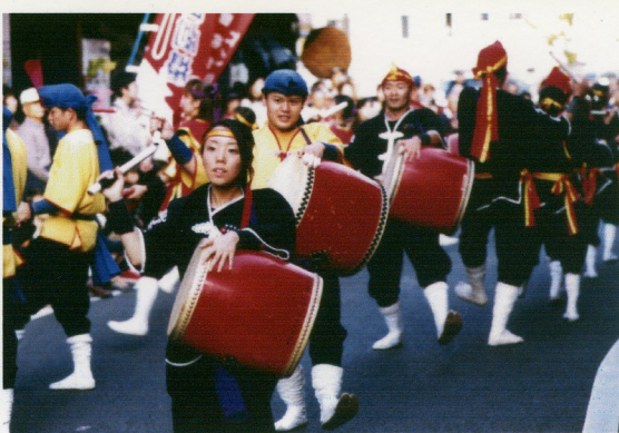
パレードは一に体力二に気力です。でも本当に全部出し切った後は観客の皆様の声援、笑顔がエネルギーになるのです。コレホントです☆☆☆

今年も幸運に授かり、桜の舞う4月13・14日、『成田山新勝寺』関東一の太鼓祭り、『成田』に参加してきました。成田駅から新勝寺までのパレード、初日に本堂前で繰り広げられる幻想的な千年夜舞台。年間を通じ、メンバーにとって想い出・想い入れのある祭りです。今年も、より心に響く演舞を目指し練習に取り組みました。中でも数ある団体の中から4団体のみの出演となる、千年夜舞台に向けて力を入れました。今回第14幕では、前半は新しい創作曲、後半は基本曲というコンセプトで構成しました。オーブニングは津軽三味線、雅楽、蛇皮線のコラボレートに乗せて、『あ・うん獅子』姫神の『神々の詩』に続いては、『琉球ヨ